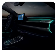
Iluminación ambiental configurable