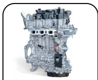
MOTOR HÍBRIDO 1.2L